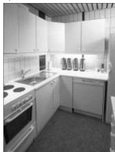
k j ø k k e n