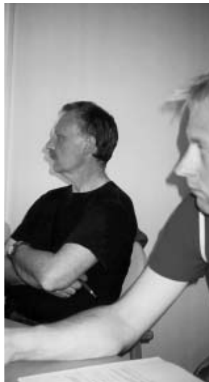
Det er ingen sløve og skoltrette ungdommer som sitter på skolebenken her, nei. Det er voksne folk.